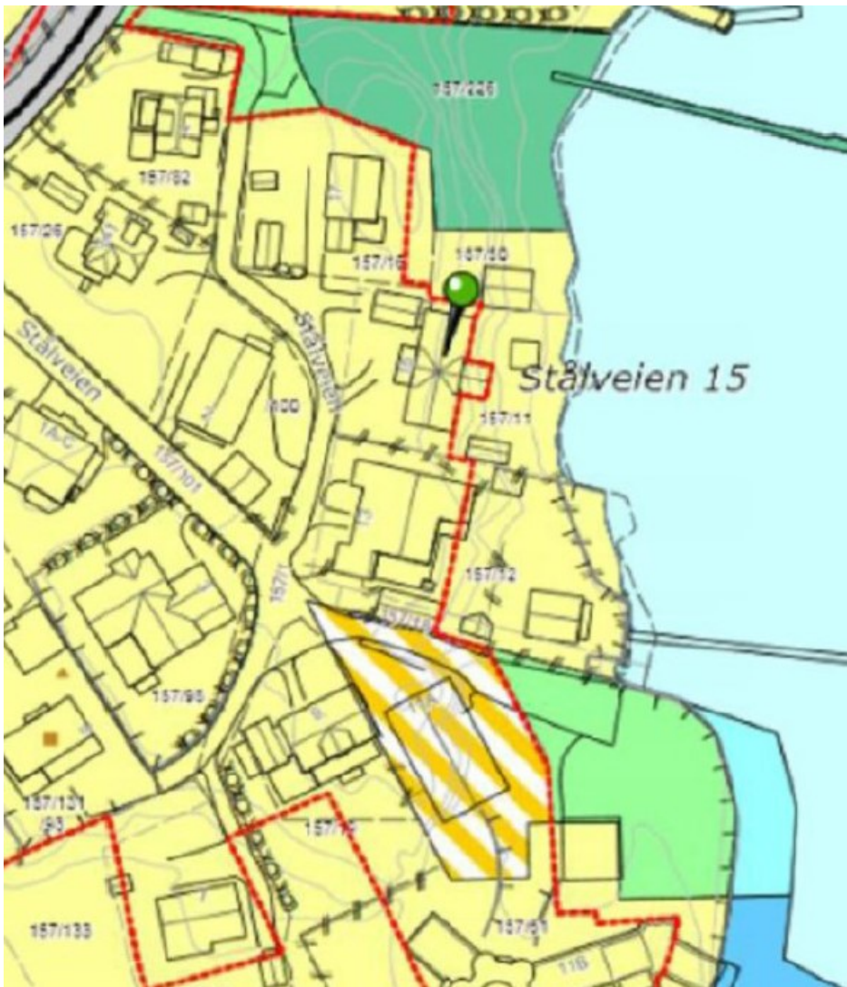
Figur 2 – utsnitt av plankart som viser arealformål (bolig) og byggegrense mot sjøen (rød linje). Kartet viser også friorådene nord og sør for eiendommen.