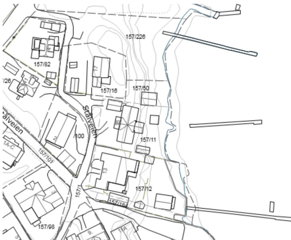
Figur 1 - utsnitt av kart 20.04.2018. Bryggen er inntegnet etter flyfoto og viser plassering og størrelse på vedtakstidspunktet.