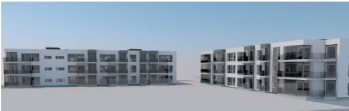
Fasade - alle balkonger innglasset