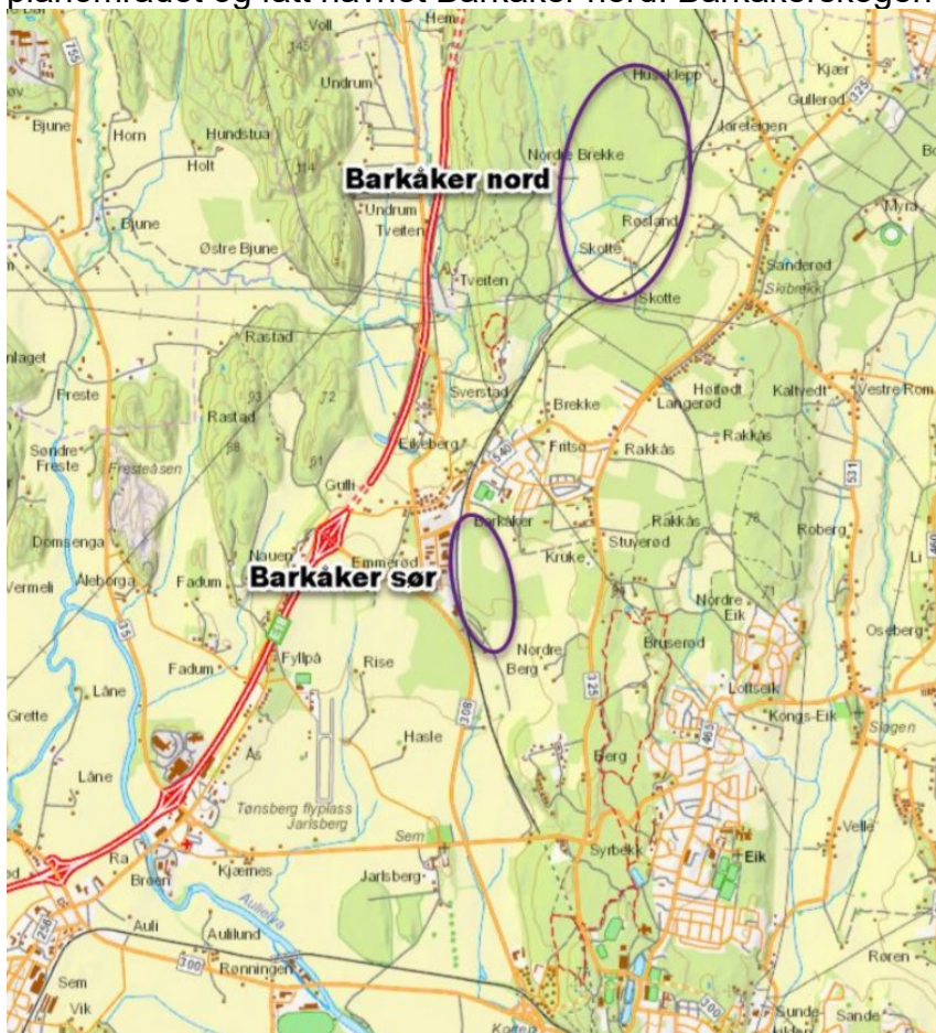
Figur 3: Alternativer som skal utredes.

I varsel om planoppstart er Brekkeskogen og Skottebakken slått sammen til et planområdet og fått navnet Barkåker nord. Barkåkerskogen er benevnt som Barkåker sør.