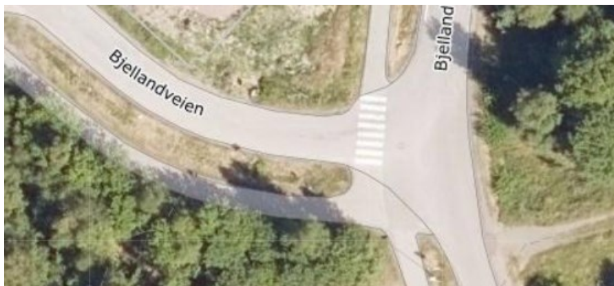
Fig.1 Viser krysset «lille» Bjellandveien x Bjellandveien.

ikke knyttes rekkefølgekrav til denne delen (Larveveien og «lille» Bjellandveien). Rådmannen mener imidlertid at krysset Bjellandveien vest («lille» Bjellandveien) x Bjellandveien bør utbedres. Dette krysset er utflytende med et udefinert skille mellom areal avsatt til myke trafikanter og areal avsatt til biltrafikk. Se bilde under.