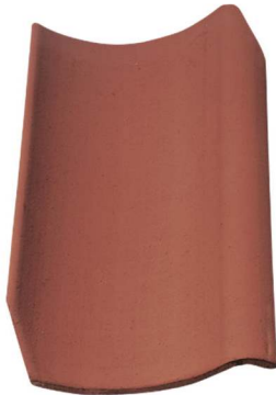
Fig.3 Takstein RT 806 eller tilsvarende

Deler av eksisterende stein er byttet ut oppigjennom og ivaretar ikke den særegne sveitserstil karakteren. Bygget vil få ny takstein type rød og enkelkrum. Se fig.3