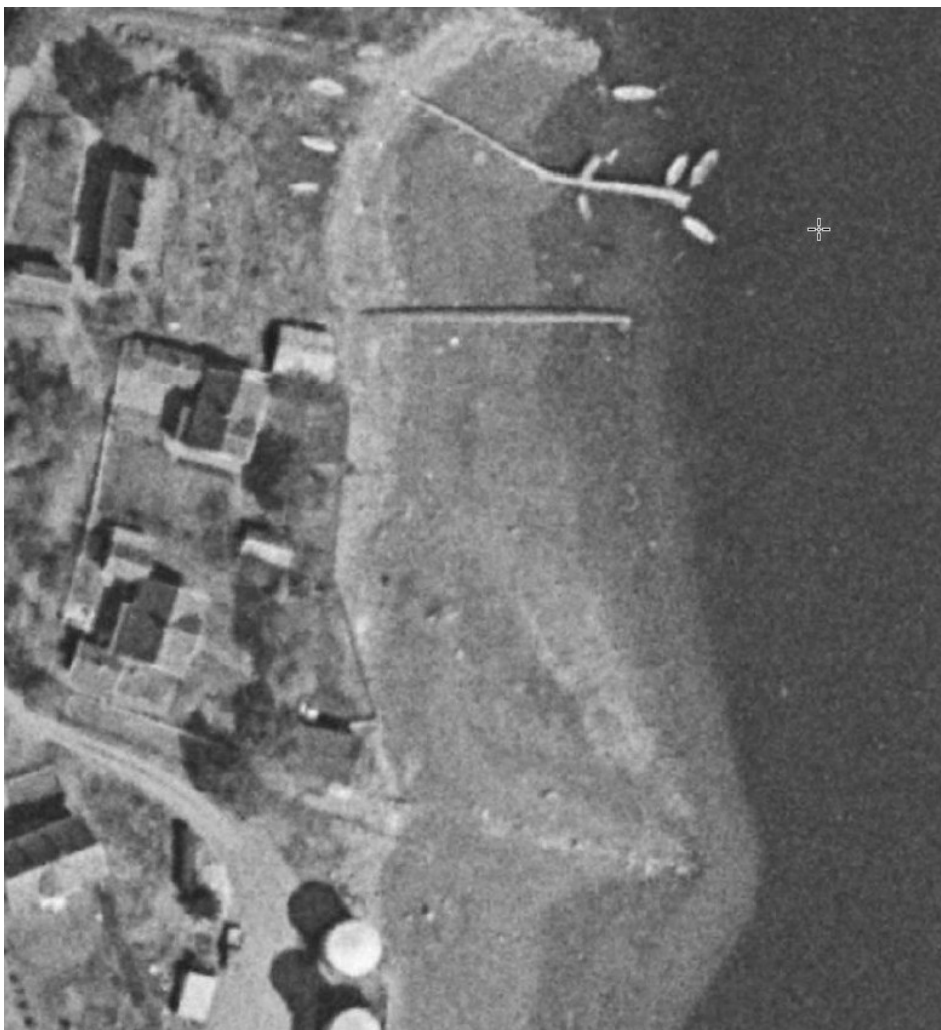
Figur 3 – flyfoto tatt i perioden 1959-1979

Rådmannen har ingen grunn til å betvile at det har vært én eller flere brygger på eiendommen i dette tidsrommet. Det er imidlertid noe tvil om når den siste bryggen ble fjernet/ødelagt. Tiltakshaver opplyser at dette skjedde som følge av springflo i 1987, men bryggen er ikke synlig på flyfoto som har sikker datering fra perioden 1959-1979. En mulighet kan være at flyfotoet er tatt i periode hvor den eldre bryggen er fjernet, men før den er erstattet av ny.