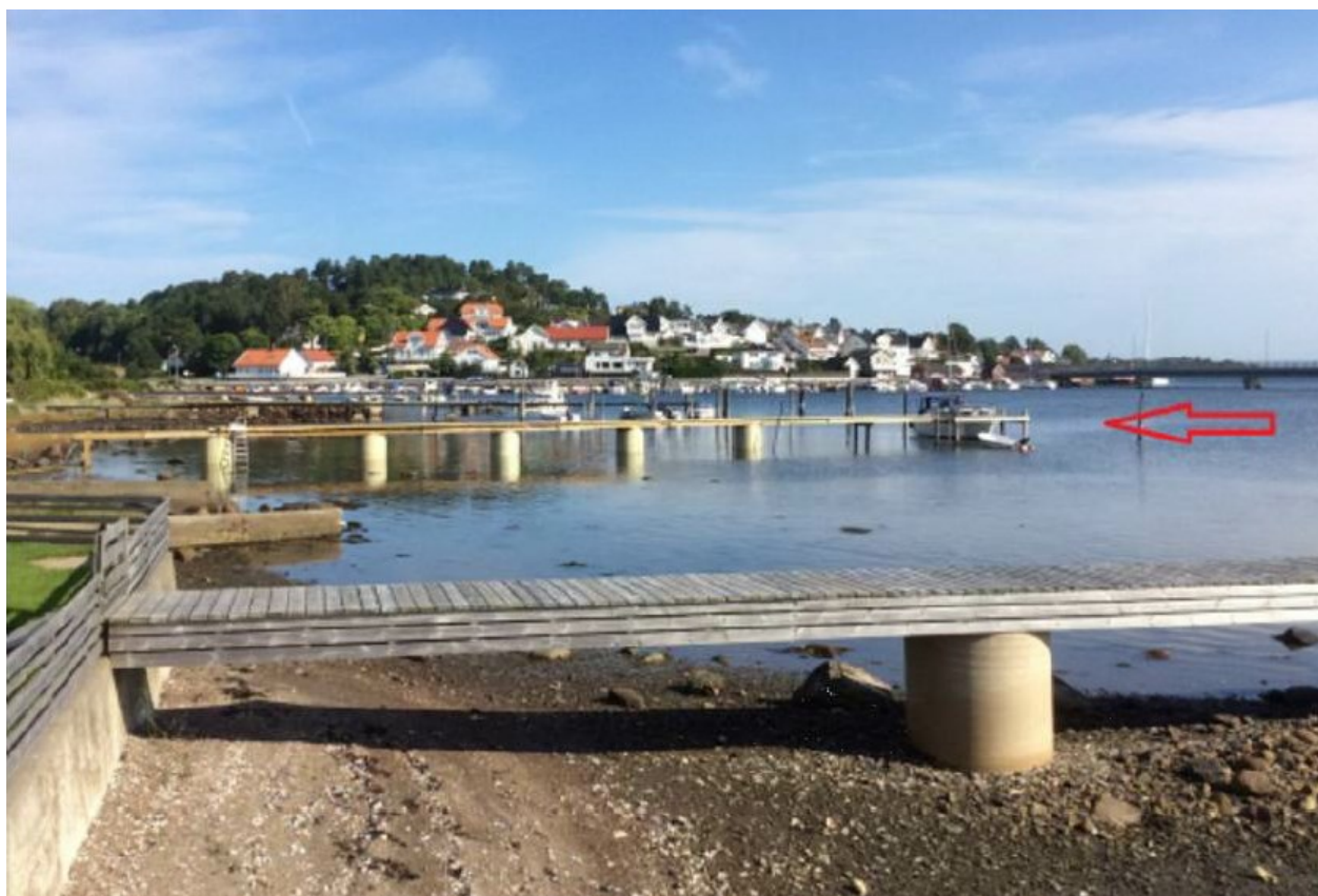
Figur 1 - fotografi fra befaring 02.09.2016